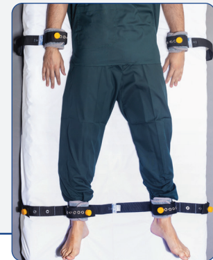
4 Lock buttons