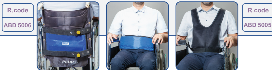
کمر بند ویلچری با قفل مغناطیسی

The belt have been designed to provide a simple but firm subjection to weak or unstable patients. ARIANA belts have different models to adequate to different needs. It is adjusted to the chair by means of strong polyester straps on both sides and tied together at the back of the seat. The belt is washable up to 40°C.